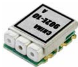
#AF3B 10 x 13.5 x 4.0 mm