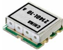
#AF3C 13 x 12 x 4.0 mm